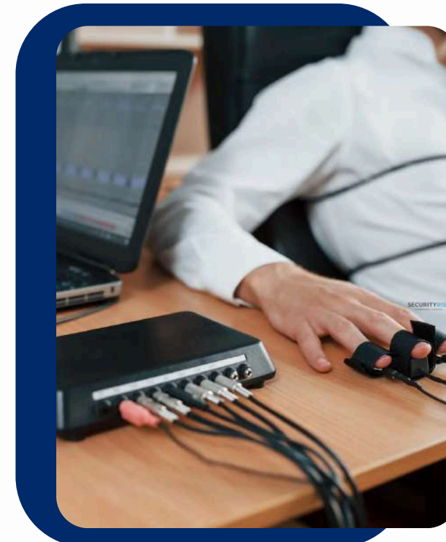
PRUEBAS DE CONFIANZA POLÍGRAFO