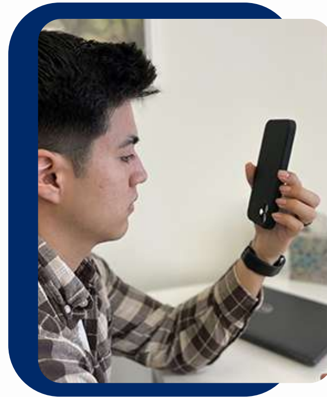
PRUEBAS DE CONFIANZA VERIFEYE APP