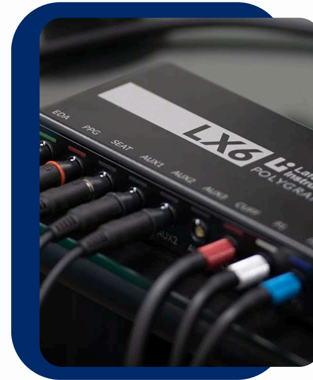
VENTA DE EQUIPOS LAFAYETTE