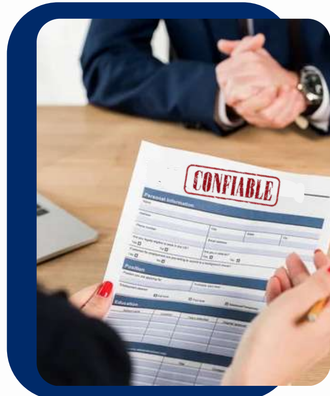
ESTUDIOS DE CONFIABILIDAD