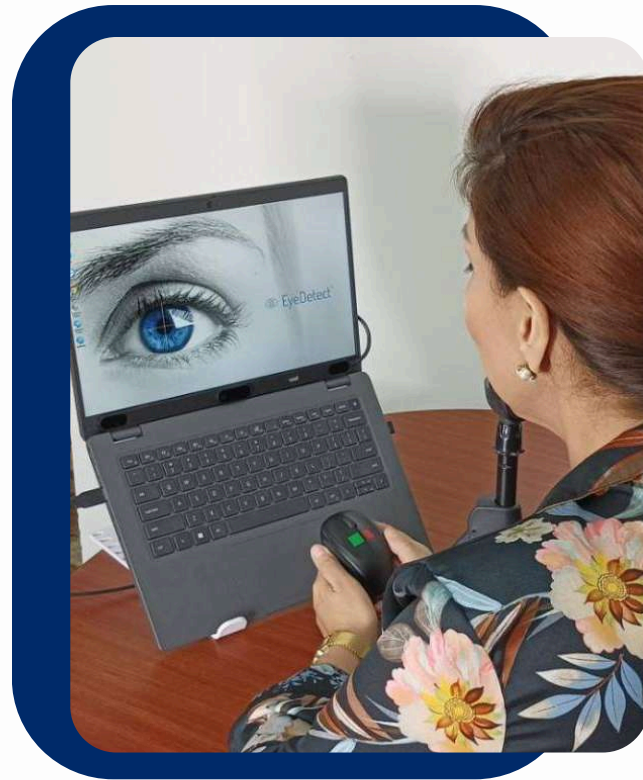
PRUEBAS DE CONFIANZA EYEDTECT