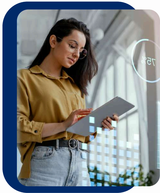
DIGITALIZACIÓN DE PROCESOS DE SEGURIDAD