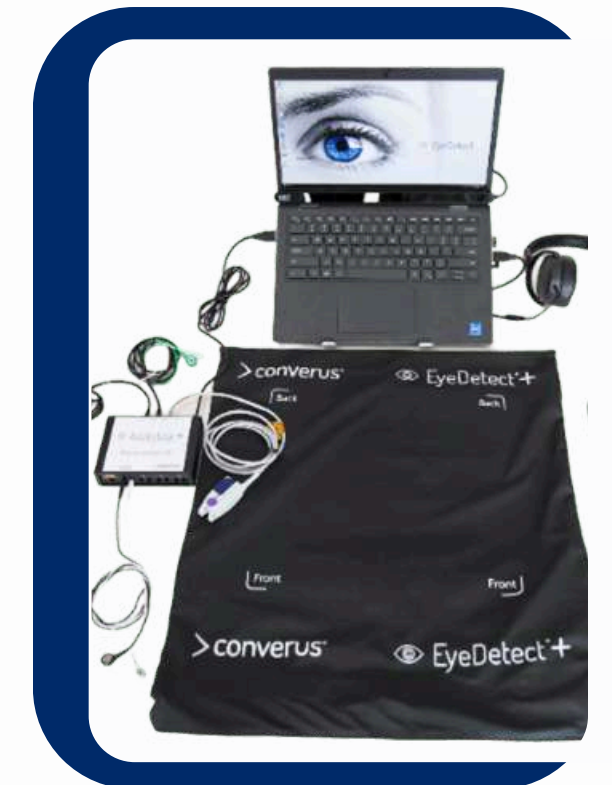
VENTA DE EQUIPOS EYEDTECT